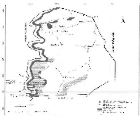
Figure 2 : Carte de la commune d'Ouinhi

Afin de mettre en confiance les cibles de l'enquête et assurer la fiabilité des informations à recueillir, l'enquête ethnobotanique a nécessité une phase de préparation du terrain. A cet effet, des rencontres et discussions avec des tradipraticiens de la commune de Ouinhi et le médecin-chef du CSC ont été effectuées.