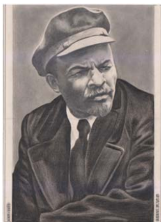
« Lénine », 30 x 40 cm, 1979, dessin au crayon sur papier, Philippe Abayi.

Ce tableau réalisé par l'artiste Philippe Abayi sur commande de la présidence de la République présente un personnage habillé en toge, tenant dans la main droite une hache à double tranchant et dans la main gauche le sceau de la justice qui est soulevé à la hauteur des épaules. La carte du Bénin dessinée à l'arrière-plan, laisse entrevoir de petits personnages noirs qui sont torses nus. Les couleurs vert, jaune, rouge dominantes dans cette œuvre sont celles du drapeau nationale symbole de l'unité. Pour le gouvernement révolutionnaire tous les citoyens sans distinction de sexe ni de classe sociale sont égaux et ont les mêmes droits devant la loi. Chaque citoyen a le droit d'être heureux. C'est la prospérité partagée prônée par le gouvernement. Le riche et le pauvre sont égaux devant la loi.